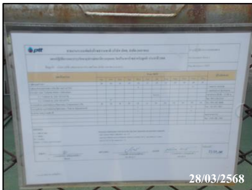
ภาพที่ 1 คัดแผนการปฏิบัติและบำรุงรักษาอุปกรณ์ สถานีควบคุมความดัน และวัดปริมาตรก๊าซ