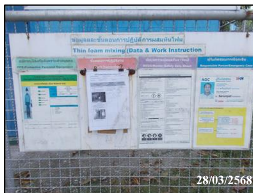
ภาพที่ 4 คัดป้ายแสดงขั้นตอนการปฏิบัติ และ ผู้รับผิดชอบกรณีฉุกเฉิน