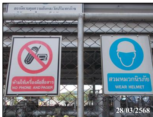
ภาพที่ 5 การติดตั้งป้ายเตือนอันตราย และป้ายเตือนความปลอดภัย