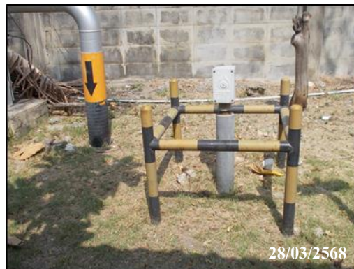
ภาพที่ 2 บริเวณระบบควบคุมดันทางท่อส่งก๊าซ