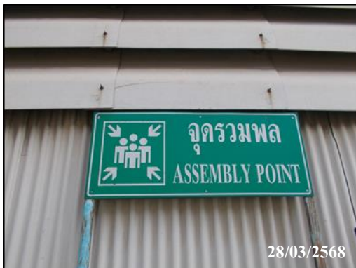
ภาพที่ 13 การติดตั้งป้ายจุดรวมพล