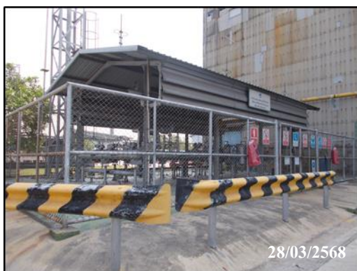
ภาพที่ 3 บริเวณสถานีควบคุมความดัน และวัดปริมาตรก๊าซ