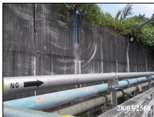
ภาพที่ 6 ข้อความบ่งชี้อันตรายตามแนวท่อส่งก๊าซ