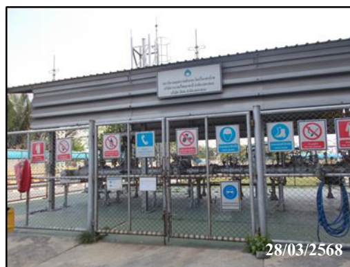
ภาพที่ 5 (ต่อ) การติดตั้งป้ายเตือนอันตราย และป้ายเตือนความปลอดภัย